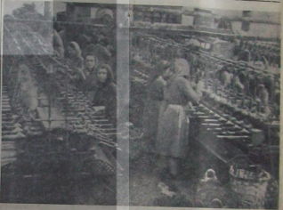
Samsatlık Defterdar Mensucat Fabrikası'nın durumu.

Karpet (Öst.) — Bez fabrikaları işçileri, ücretlerinin arttırılması için hakem kuruluna başvurmuşlardır. İşçiler, ücretlerinin arttırılmasını talep etmişlerdir.